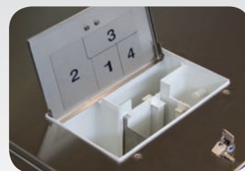
Dosage interne LS-332

OPTIONS DE CHAUFFAGE: Électrique, Vapeur, Sans chauffage (apport externe d'eau chaude).