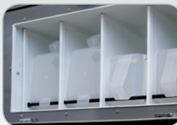
Dosage interne LS-355

Les produits chimiques sont dans tous les cas dilués préalablement dans le collecteur, pour éviter ainsi abîmer le tissu à cause du contact direct.